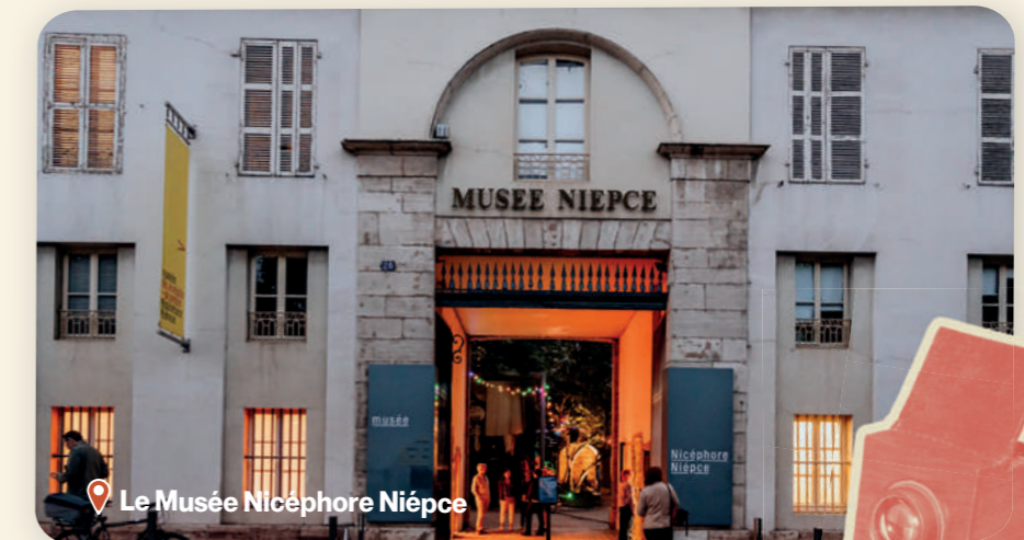
📍 Le Musée Nicéphore Niépce

Installé dans un élégant hôtel particulier du XVIII e siècle, retrouvez une lecture claire et vivante de l'évolution urbaine de la ville. Maquettes, archives, expositions temporaires et dispositifs interactifs, de quoi arpenter son passé antique tout en découvrant les projets plus contemporains qui animent Chalon.