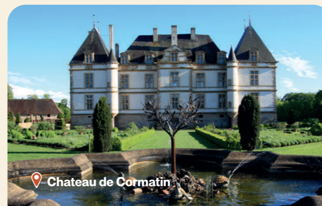
Château de Cormatin

En fin de journée, retour à votre hôtel à Chalon-sur-Saône , dîner et nuitée sur place.