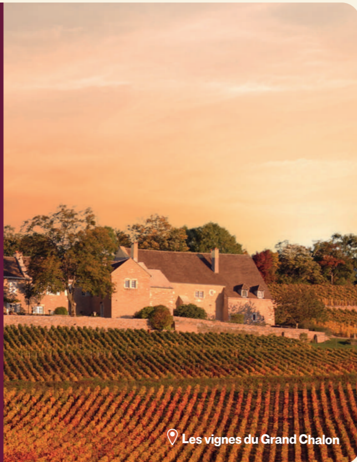
Les vignes du Grand Chalon

Des visites accessibles, variées, à intégrer facilement dans un séjour en groupe.