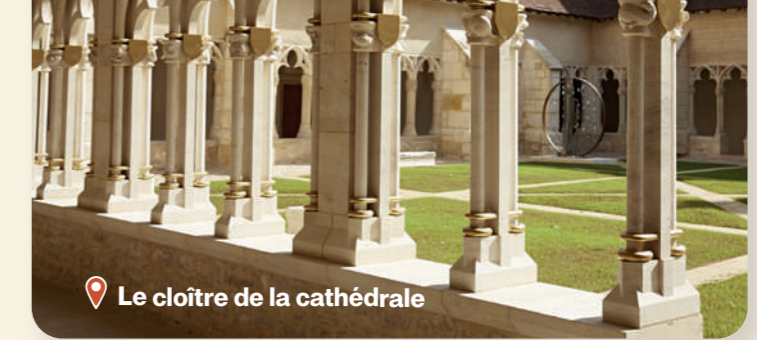
📍 Le cloître de la cathédrale

La cathédrale Saint-Vincent et son cloître qui constituent un passage incontournable au cœur du centre historique.