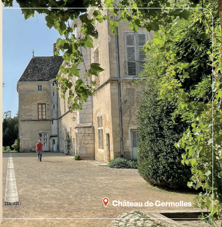
Château de Germolles

Chaque programme peut être ajusté selon vos contraintes et vos envies.